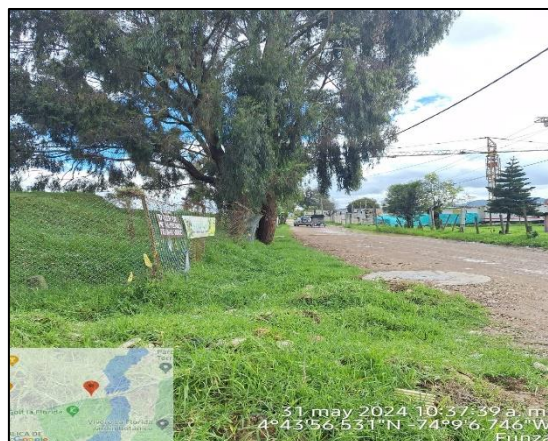
Ilustración 2. Evidencias del recorrido.